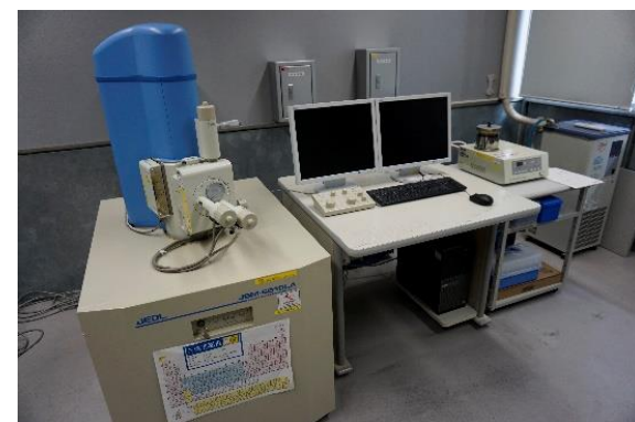
走査型電子顕微鏡 (5,650円/時間)