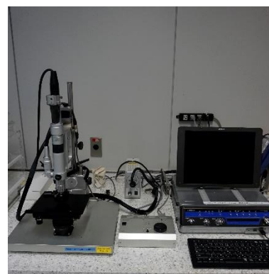
マイクロスコープ (1,440円/時間)