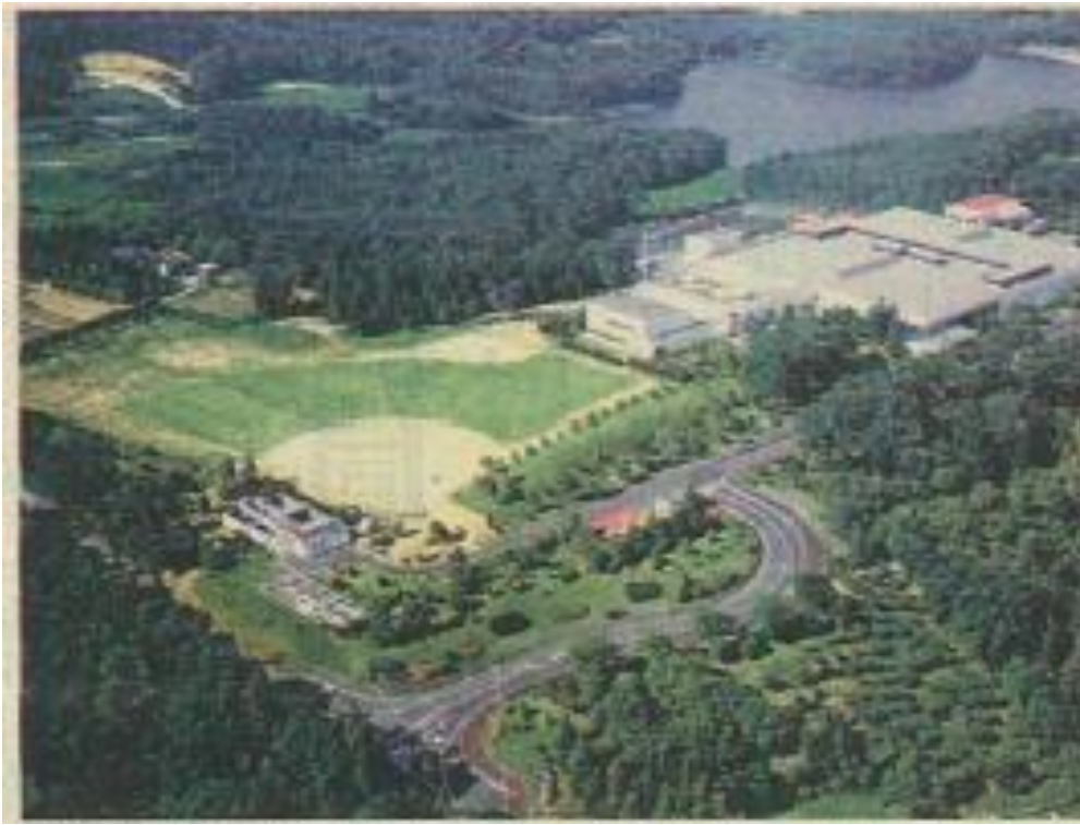
液剤用医薬品製造工場 上空写真