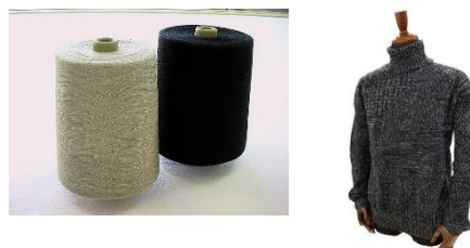
図3 改質リネン糸と試作品

本事業では、天然繊維（リネン）と機能性（保温性、吸放湿性等）の関係を明らかにし、両機能性（保温率 \geq 20\% 、吸放湿能力 \Delta MR \geq 25\% ）を兼ね備えた改質リネンの素材構成について提案を行いました。