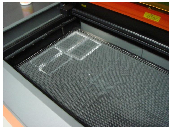
カッティング用ハニカムテーブル